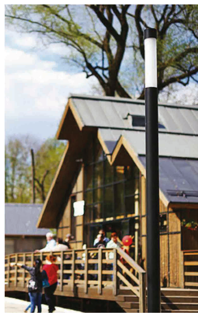
СВЕТИЛЬНИК "СТРИТ ПРЕМЬЕР" Alfresco