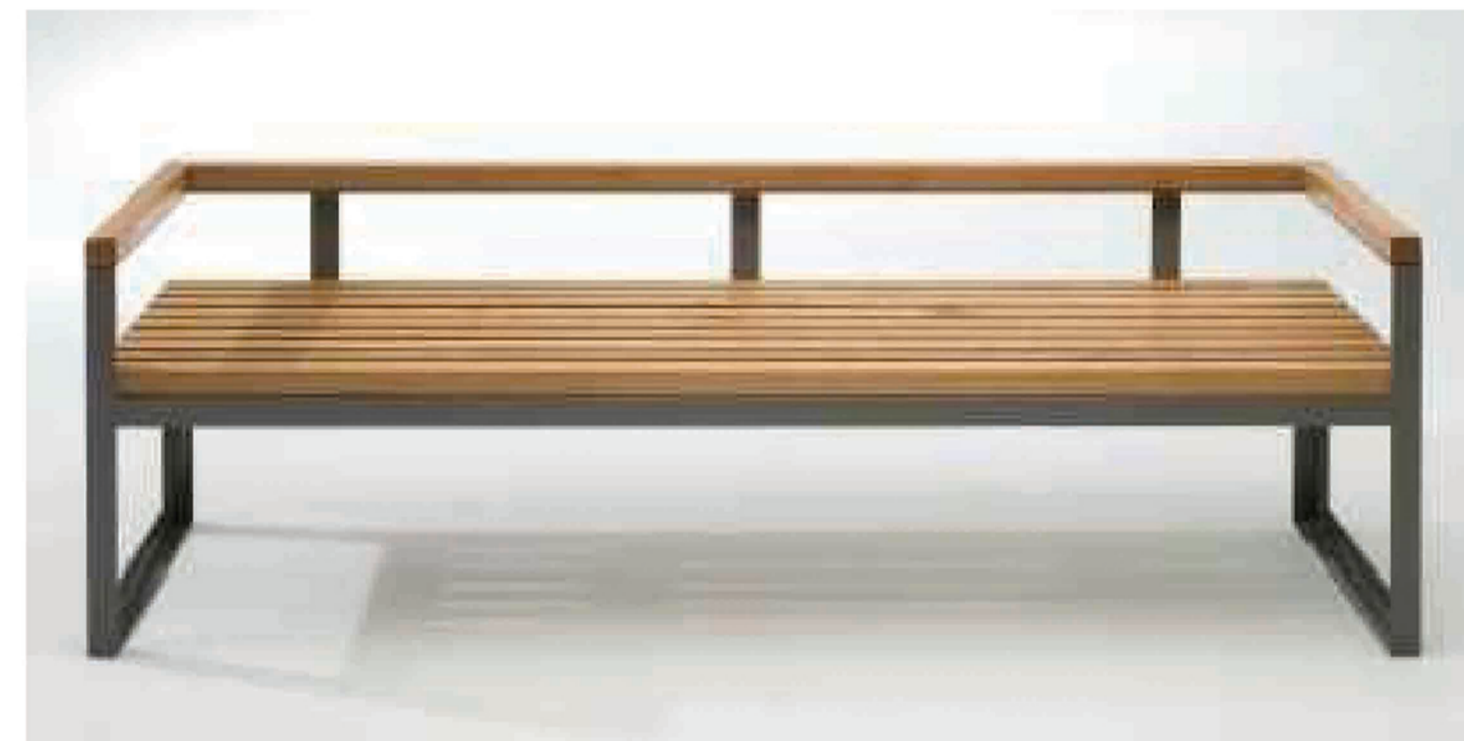
СКАМЬЯ СО СПИНКОЙ