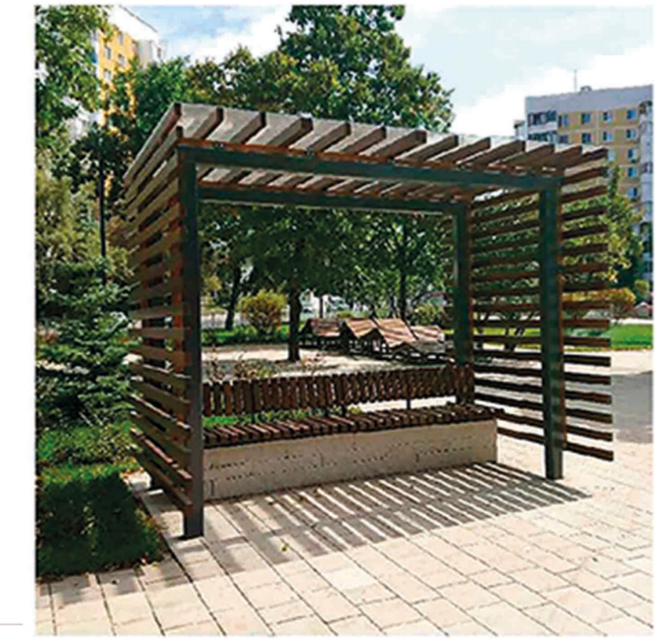
Перголы (скамейки с навесами)