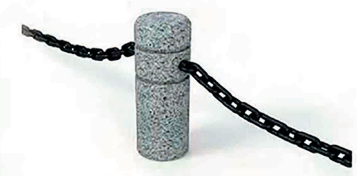
ОГРАЖДЕНИЕ. МОДЕЛЬ МС-5G