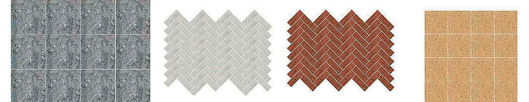
СХЕМА РАСКЛАДКИ ПЛИТОЧНОГО МОЩЕНИЯ ТРОТУАРНАЯ ПЛИТКА. ПРОИЗВОДИТЕЛЬ: Г. САМАРА ООО "ФАРШТАЙН". МОЩЕНИЕ РЕКРЕАЦИОННЫХ ЗОН