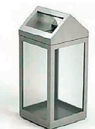
УРНА УЛИЧНАЯ. МОДЕЛЬ РУ-5