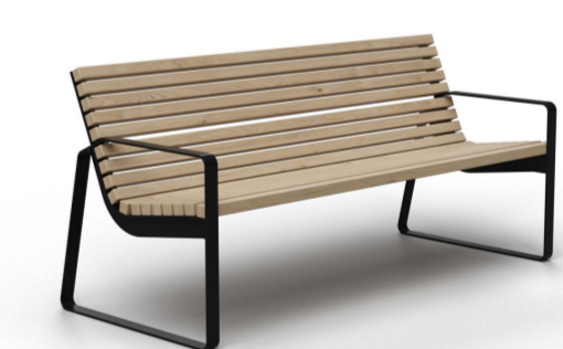
СКАМЬЯ ПАРКОВАЯ СО СПИНКОЙ. МОДЕЛЬ СКМ 036