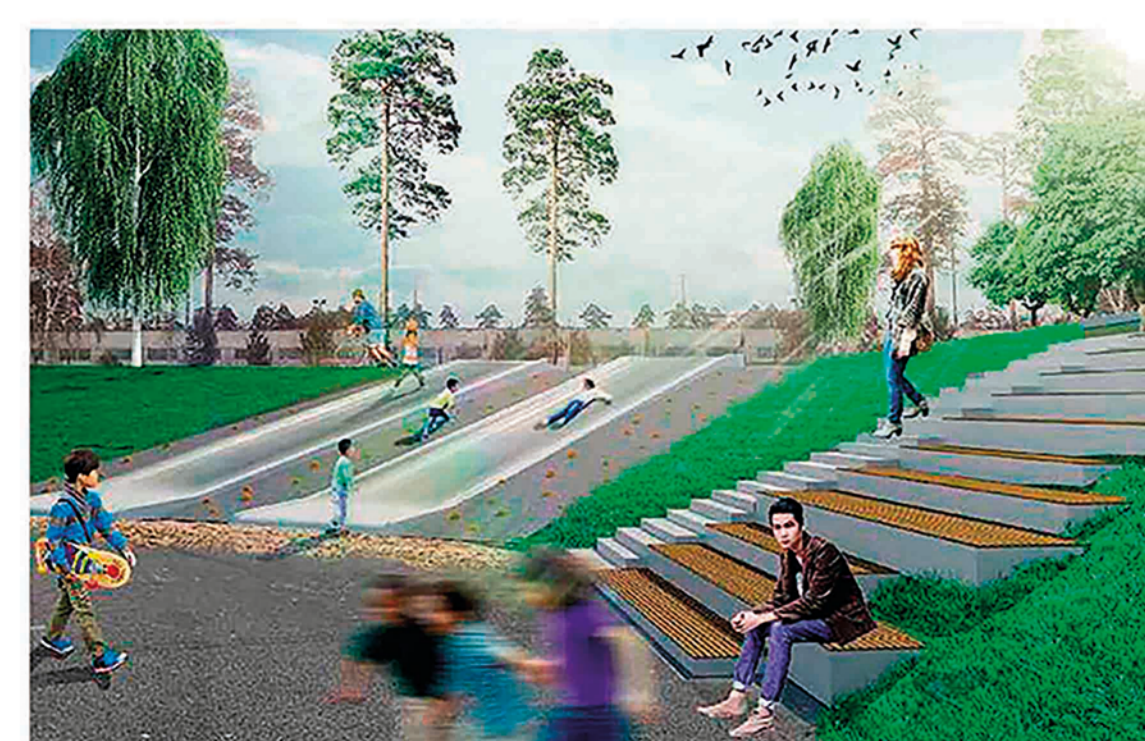
ИГРОВАЯ ПЛОЩАДКА НА СКЛОНЕ