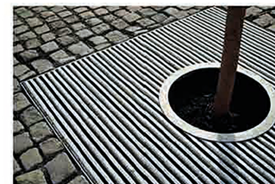
Решётки для деревьев