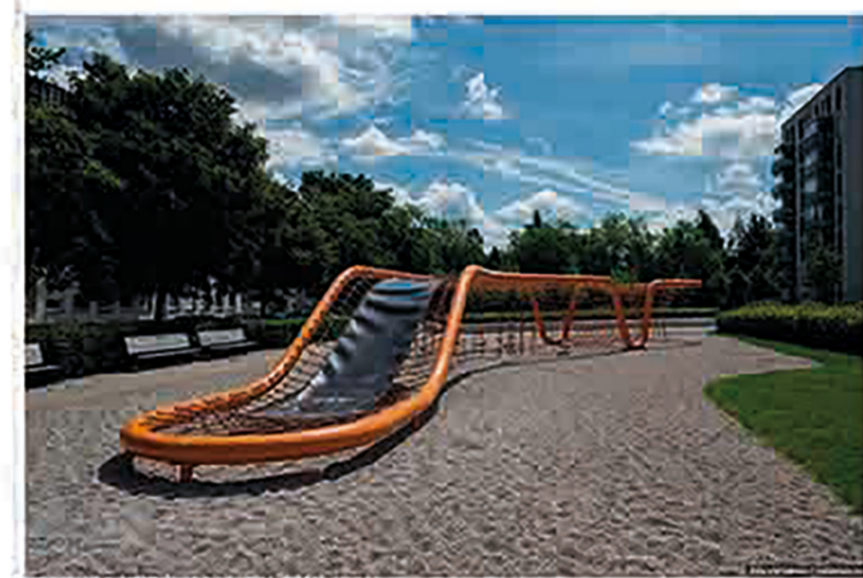
Детские игровые площадки