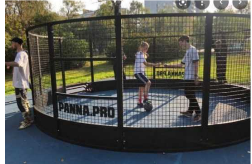
Спортивные площадки/панна футбол