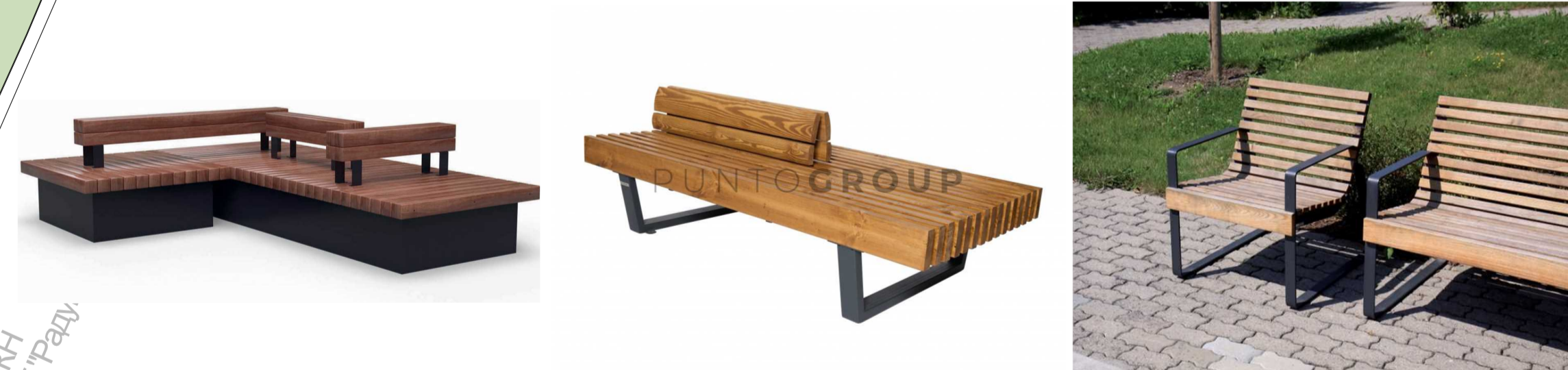
Малые формы архитектуры/скамьи парковые, урны, навесы теневые