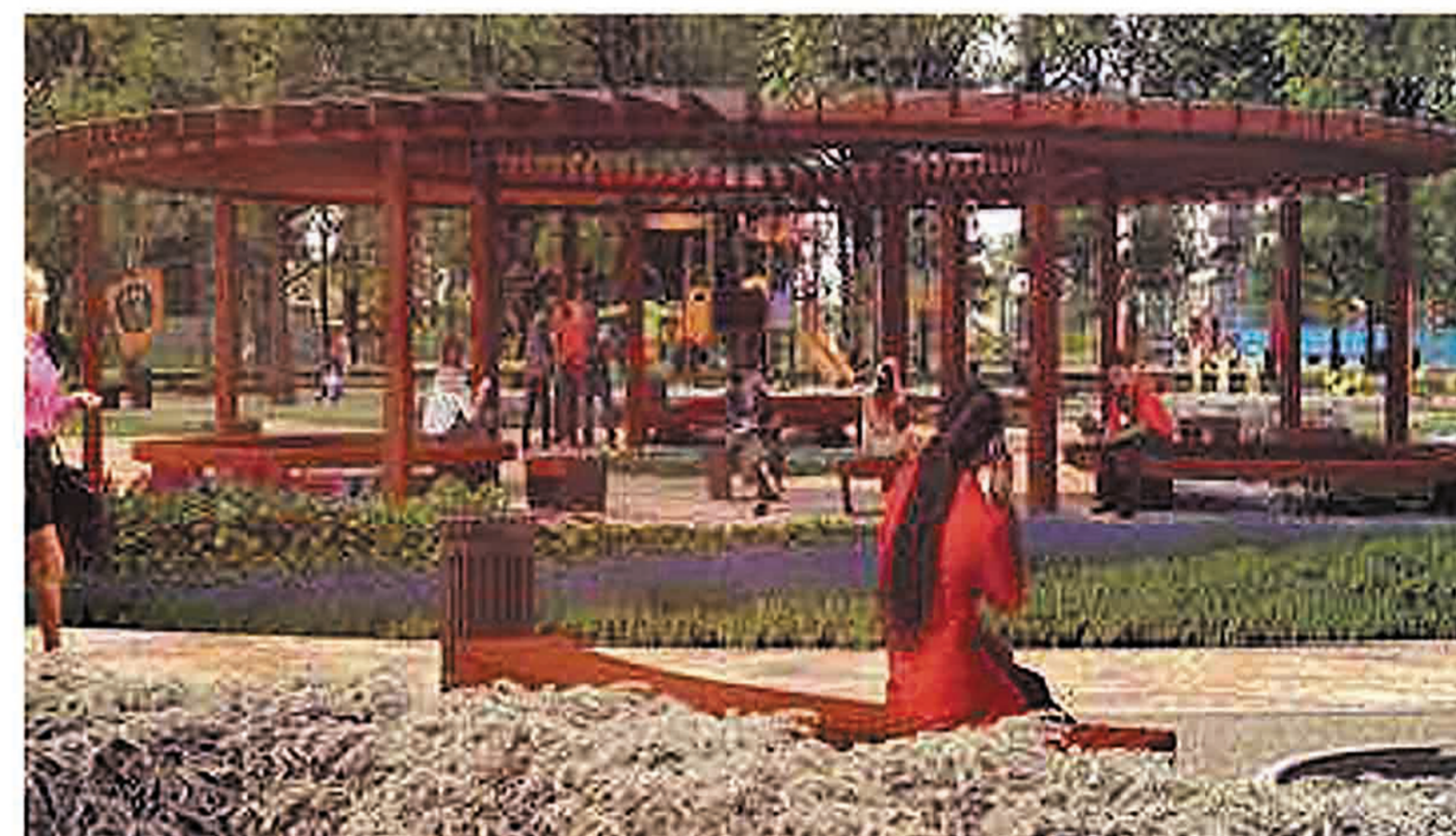
Качели с навесом