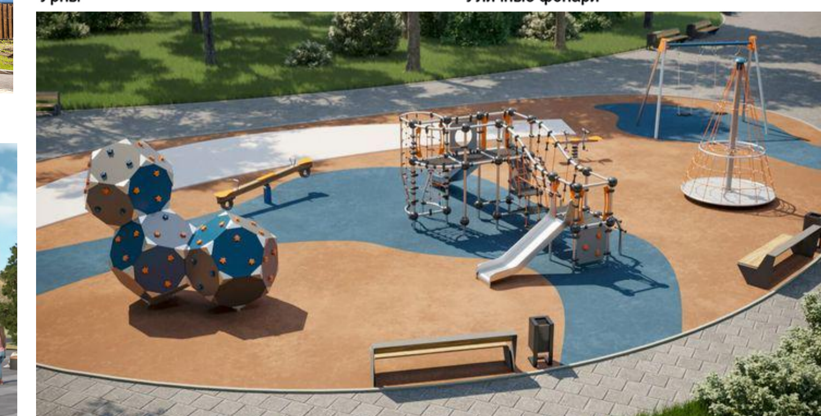
Детская игровая площадка