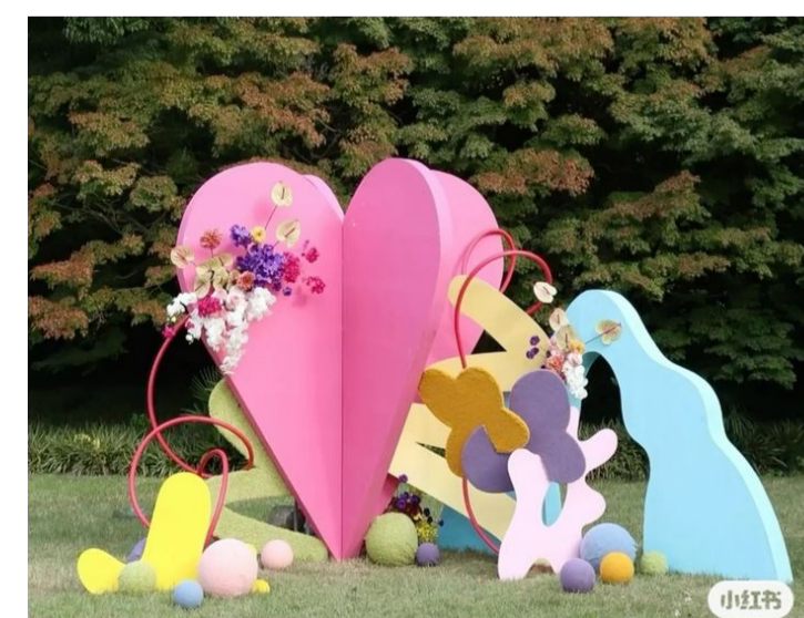
Пример фотозоны. Индивидуальное проектирование