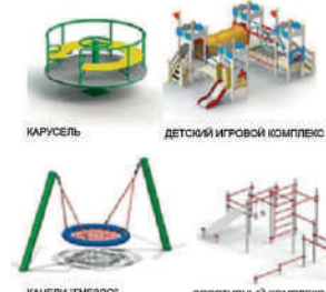
КАРУСЕЛЬ ДЕТСКИЙ ИГРОВОЙ КОМПЛЕКС КАЧЕЛИ "ТНЕЗДО" СПОРТИВНЫЙ КОМПЛЕКС