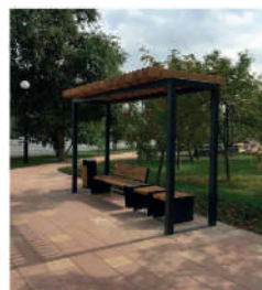
СКАМЬЯ С НАВЕСОМ