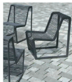
ПАРКОВАЯ СКАМЬЯ LLP205