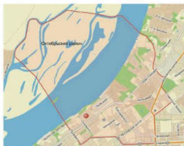
СХЕМА РАСПОЛОЖЕНИЯ ОБЪЕКТА В ГОРОДЕ

Будут установлены малые архитектурные формы и элементы уличной мебели, восстановлены пешеходные дорожки, установлены опоры освещения вдоль пешеходных зон, высажены зелёные насаждения и выполнено устройство газонов, также запланировано устройство автополива и системы видеонаблюдения.