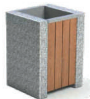
УРНА УЛИЧНАЯ. МОДЕЛЬ КУ-5G