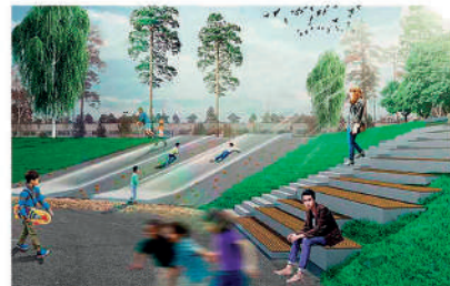
ИГРОВАЯ ПЛОЩАДКА НА СКЛОНЕ