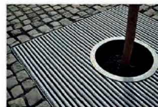
Решетки для деревьев