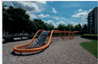
Детские игровые площадки