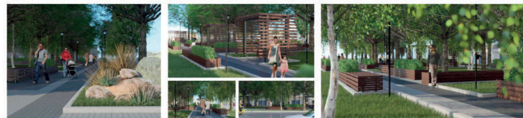
ЗД ВИЗУАЛИЗАЦИЯ СКВЕРА, РАСПОЛОЖЕНИЕ МАЛЫХ АРХИТЕКТУРНЫХ ФОРМ

Сквер «Аврора» находится в границах ул.Артемовской и ул.Печерской вдоль ул.Авроры в Октябрьском внутригородском районе городского округа Самара. Концепцией благоустройства предусмотрено общее улучшение среды и образа сквера, которое приведет к стимулированию социальной и культурной активности граждан города. Будут восстановлены пешеходные дорожки с покрытием из тротуарной плитки и устройством пандусов, увеличена парковка около входа в магазин «Магнит», установлены скамейки и урны, выполнена санитарная обрезка зеленых насаждений и посадка новых кустарников, устройство газонов с автополивом, установка опор освещения вдоль пешеходных зон и ограждение сквера со стороны ул. Авроры.