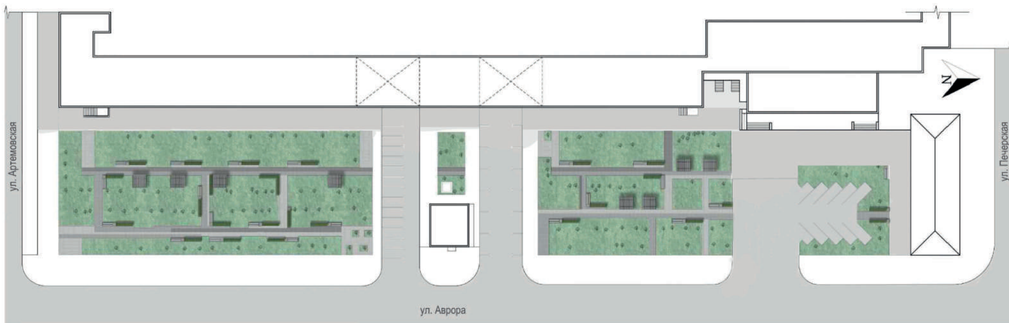
ГЕНЕРАЛЬНЫЙ ПЛАН БЛАГОУСТРОЙСТВА

СКВЕР «АВРОРА» В РАЙОНЕ ДОМА № 122 ПО УЛИЦЕ АВРОРЫ ОКТЯБРЬСКОГО ВНУТРИГОРОДСКОГО РАЙОНА Г.О. САМАРА