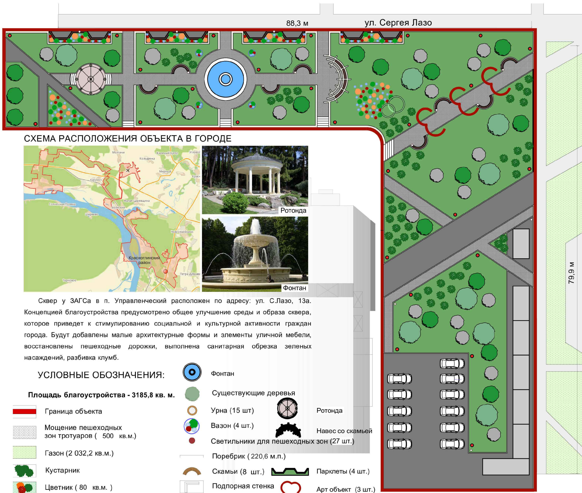
СХЕМА РАСПОЛОЖЕНИЯ ОБЪЕКТА В ГОРОДЕ