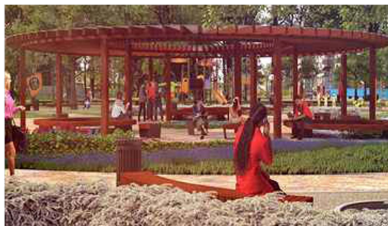
Качели с навесом