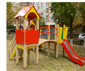
Пример детского игрового комплекса