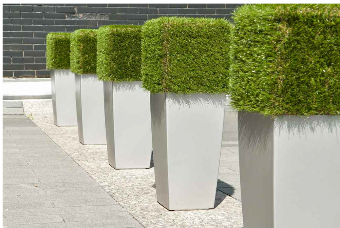
РАСТЕНИЯ В КАДКАХ

Парк им. Щорса расположен в границах улиц Спортивной, Урицкого, Красноармейской. Концепцией благоустройства предусмотрено общее улучшение среды и образа парка, которое приведет к стимулированию социальной и культурной активности граждан города. Будут отремонтирована входная группа, детская железная дорога, добавлены малые архитектурные формы и элементы уличной мебели, восстановлена «Летняя эстрада», проведена реконструкция аттракционов, выполнена санитарная обрезка зеленых насаждений, высажены новые зеленые насаждения и разбиты цветочные клумбы.