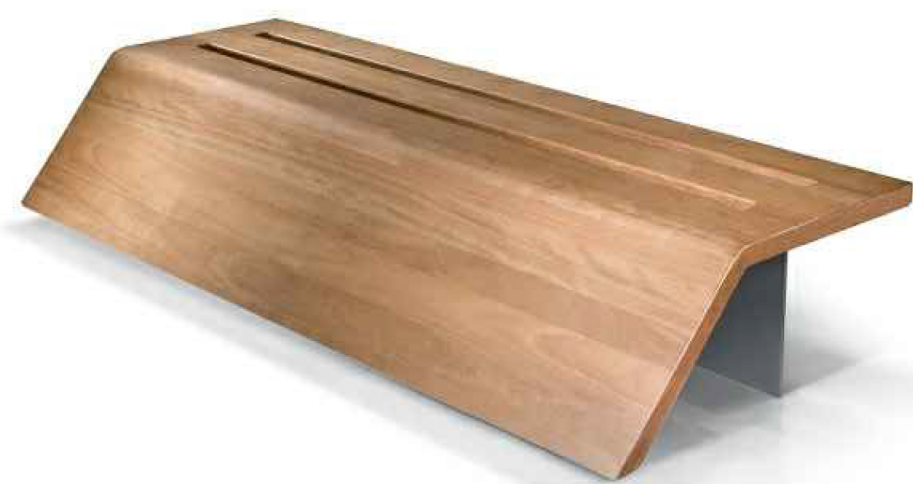
СКАМЬЯ "LAB 23 fly"