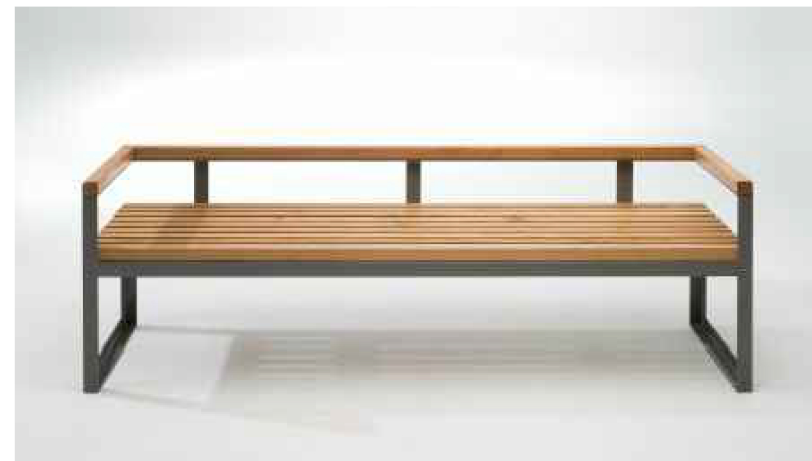
Скамья со спинкой + урна LAB-23 Zen

Сквер на пересечении Авроры и Гагарина, расположен возле домов 64 и 68 по ул. Гагарина. Концепцией благоустройства предусмотрено общее улучшение среды и образа сквера, которое приведет к стимулированию социальной и культурной активности граждан города. Будут восстановлены пешеходные дорожки, добавлены элементы уличной мебели, высажены новые зеленые насаждения, произведена санитарная обрезка деревьев.