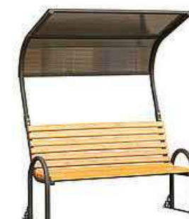
СКАМЬЯ С НАВЕСОМ