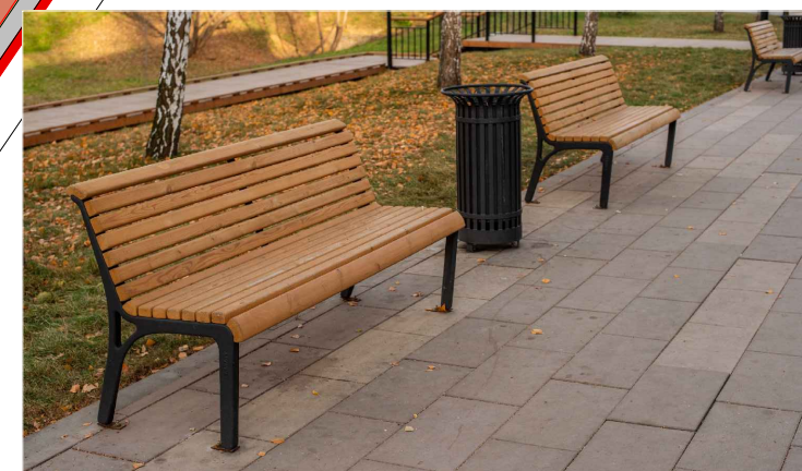
СКАМЬЯ, УРНА "АРХИМЕТ"