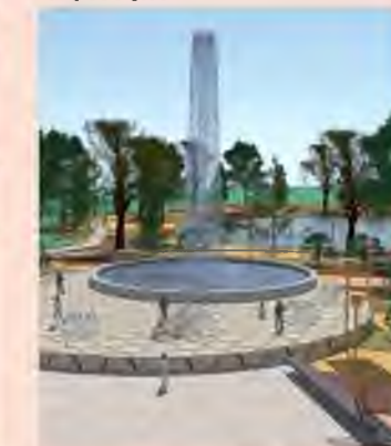
Терраса с опуском к воде