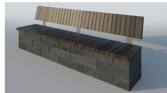
Скамья из бетонных блоков с деревянной обрешёткой ПРАГМА.