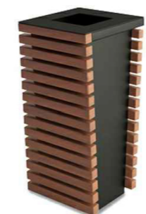
Урна "Бьянка". Армия спорта