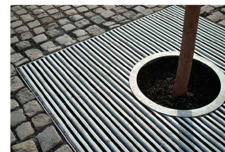
Решётки для деревьев