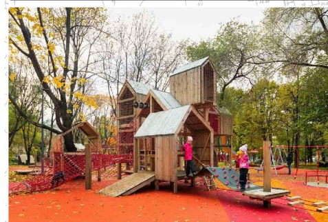
Детские игровые площадки