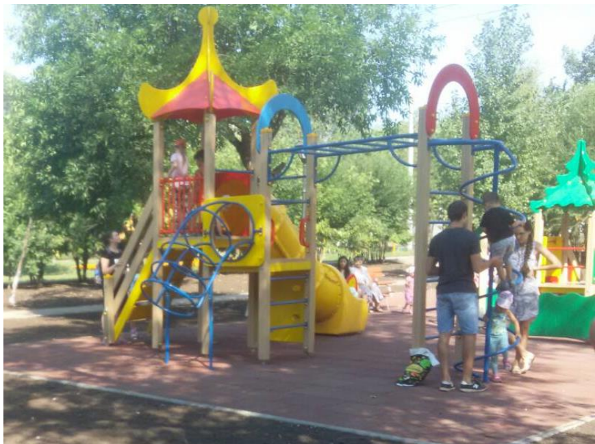
Устройство детских площадок